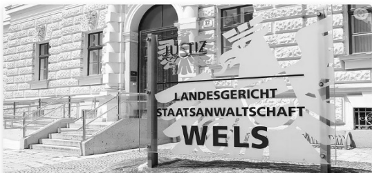
Die Staatsanwaltschaft Wels ermittelt, hält sich aber bedeckt.

Von nachrichten.at/japa, 06. April 2023, 11:31 Uhr